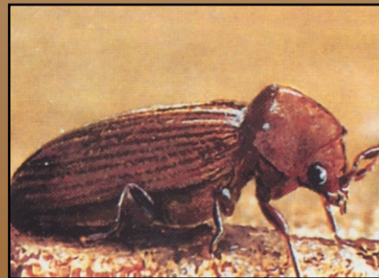
Gewöhnlicher Nagekäfer ( Anobium punctatum )