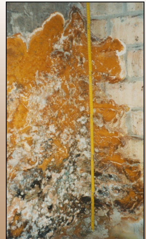
Echter Hausschwamm ( Serpula lacrymans ) Fruchtkörper auf Mauerwerk